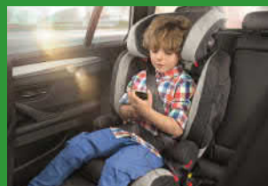
Автокресло групп II и III (для детей массой 15–36 кг)