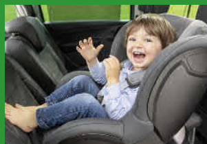
Автокресла групп I (для детей массой 9–18 кг)*