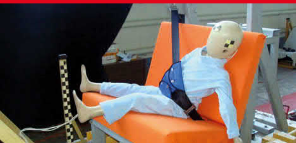
Результаты тестов использования небезопасных удерживающих устройств*

Дополнение определения «направляющая ляжка» в Правилах ЕЭК ООН № 44-04 было одобрено Всемирным Форумом (WP.29). Внесенная поправка к формулировке указывает на то, что «направляющая ляжка» рассматривается как составной элемент детской удерживающей системы и НЕ может отдельно официально утверждаться в качестве детской удерживающей системы в соответствии с настоящими Правилами». Это исключает даже формальную возможность сертификации устройств типа «направляющая ляжка»!